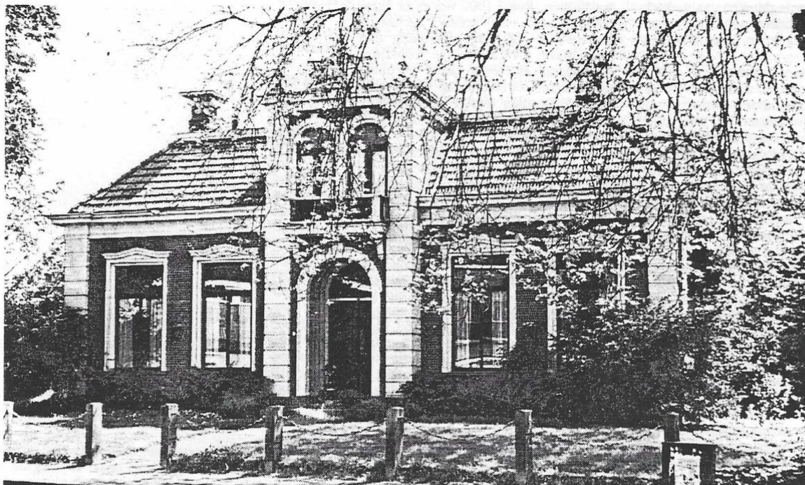
Pastorie aan de Voorstraat. Bouwjaar 1786, ingrijpend verbouwd in 1893 door timmerman Bulthuis. Voor het bouwjaar stond op dezelfde plaats ook al een pastorie, die bij de bouw van de nieuwe werd afgebroken.