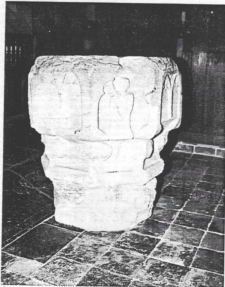
Gotisch stenen doopvont uit de periode 1450-1500. Het betreft hier een groot vont die aan de bovenkant afbeeldingen bevat van Petrus met sleutel, Paulus met zwaard, en het Godslam met kruisvlag. Verder is afgebeeld een Pelikaan, die zichzelf in de borst pikt om haar jongen te voeden met haar bloed, symbool van de zich opofferende Christus.